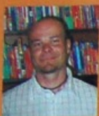
↑ Vybírá: Tomáš Lejsek